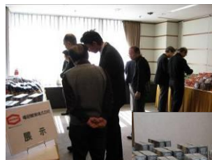
亀田製菓 展示ブース (左&下)